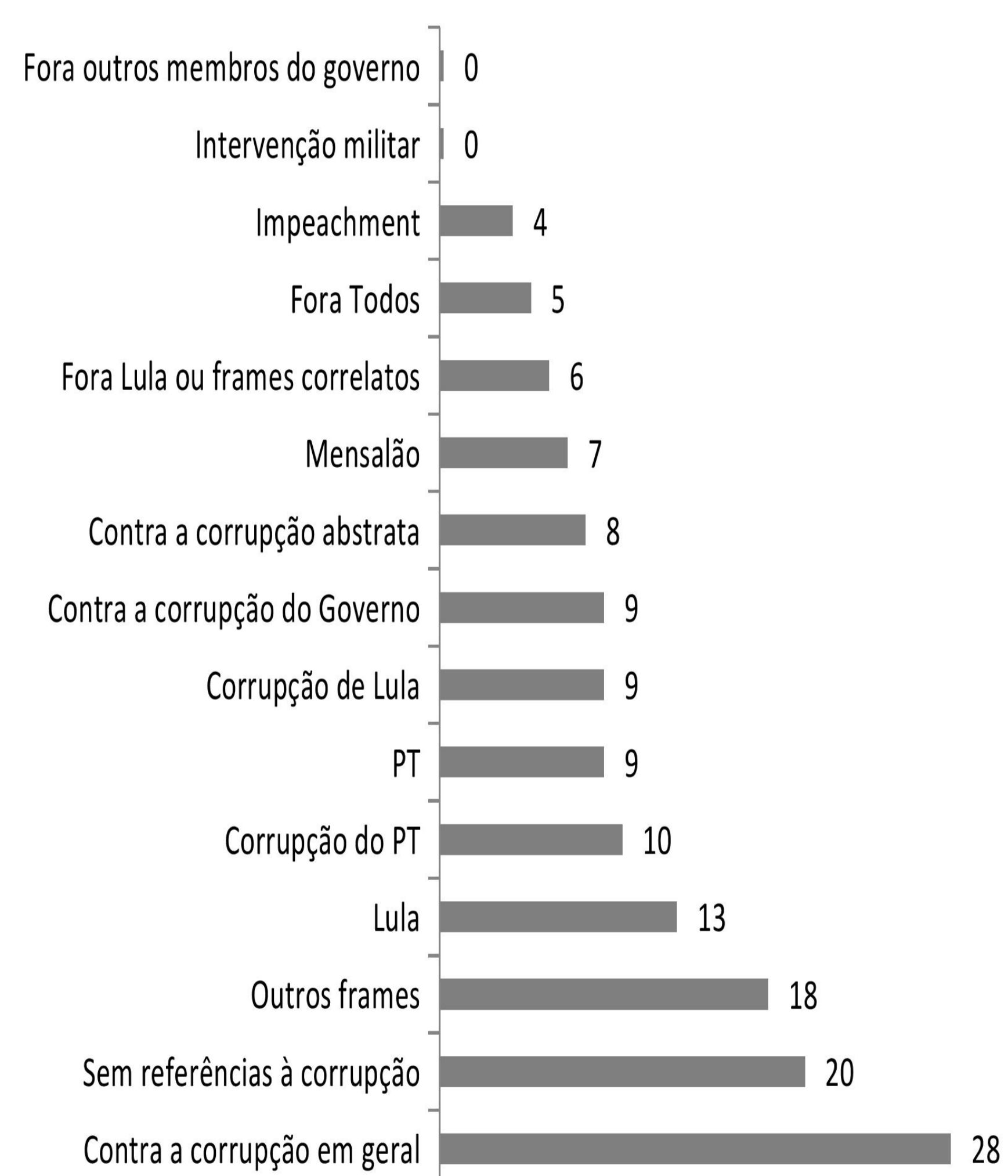
Os frames no período do Mensalão